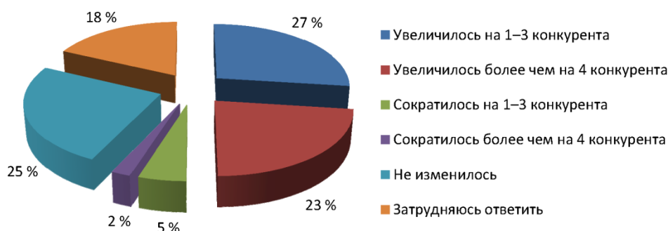
Рис. 1. Распределение ответов респондентов на вопрос «Как изменилось число конкурентов бизнеса, который вы представляете, на основном рынке товаров и услуг за последние три года?»

Как показали результаты мониторинга, более половины опрошенных представителей предпринимательского сообщества отметили наличие высокой и умеренной конкуренции на региональном рынке. Большинство опрошенных респондентов отмечают рост числа конкурентов на рынке товаров и услуг и рост количества поставщиков однородных или идентичных товаров и услуг (рис. 1). Так, 50 % опрошенных предпринимателей отметили увеличение числа конкурентов бизнеса.