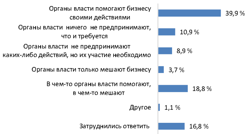
Рис. 4. Распределение ответов респондентов на вопрос «Как бы Вы охарактеризовали деятельность органов власти на основном для бизнеса, который Вы представляете, рынке?»

Кроме того, респонденты положительно оценили деятельность Федеральной антимонопольной службы и Правительства Оренбургской области, направленную на снижение административных барьеров и развитие конкуренции (рис. 4).